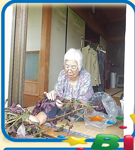
加世田 ヲキ工様 S6年 8月 15日 89歳