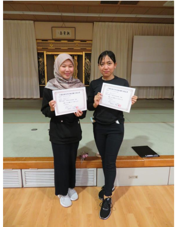
令和5年4月26日(水) 輪光福社会・山中