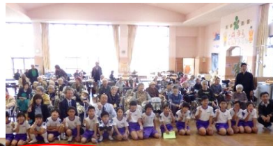
岩南小学校の生徒さん達と...

11月は岩南小の生徒との交流会・弥五郎どん祭り見学・テラスビアガーデン等多数の行事があり参加して頂きました。