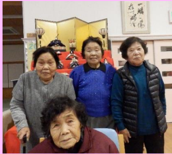
土曜日のご利用者