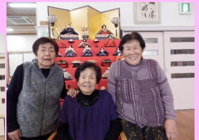
月曜日のご利用者